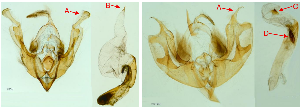
Figuur 5. Genitaliën mannetjes L. w-latinum (links; Wolfheze, 28.vi.2021. Leg. M. Franssen, col. C. Gielis), en L. thalassina (rechts; Gorssel, 15.vi.2002. Leg. en col. G. Tuinstra). Gen. prep. en foto's C. Gielis.

In de meeste gevallen zal de determinatie op basis van uiterlijke kenmerken plaats kunnen vinden. Bij afgevlagen exemplaren is wellicht onderzoek aan de genitaliën nodig voor een zekere determinatie. In figuur 5 worden de mannelijke genitaliën afgebeeld.