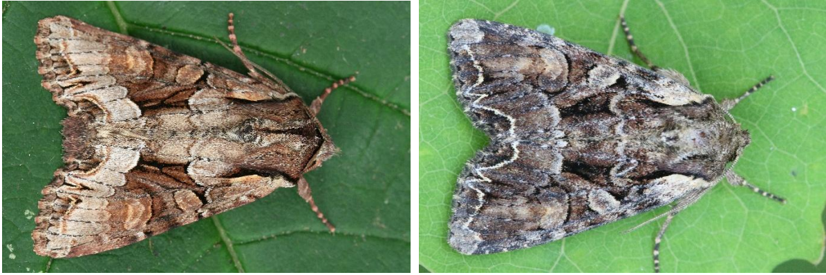
Figuur 4. L. w-latinum (links; Harich, 27.v.2022.) en L. thalassina (rechts; Harpel, 28.v.2023.) in natuurlijke houding.