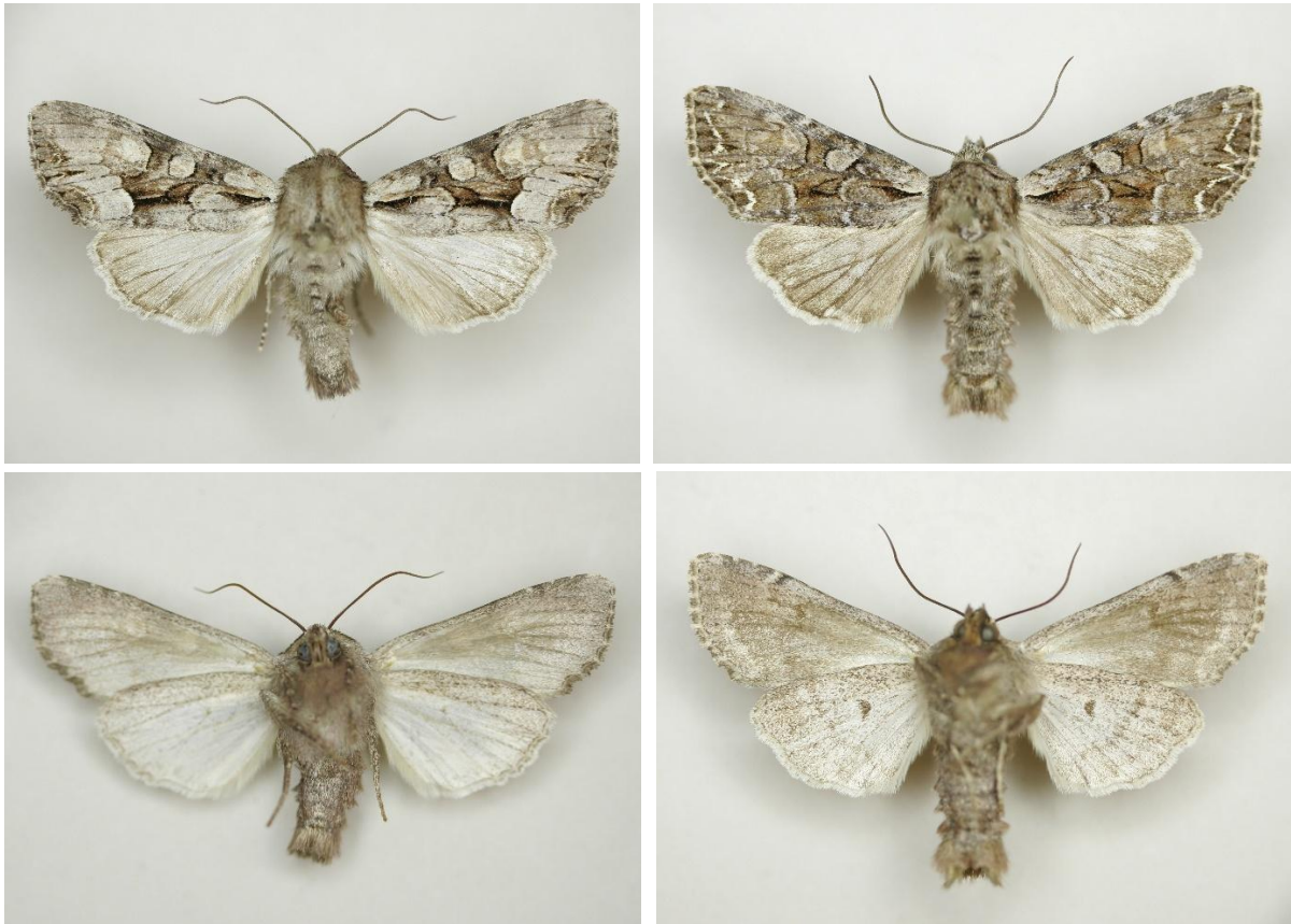
Figuur 1. Boven- en onderzijde van mannetje L. w-latinum (links; Elsloo (Frl.), 29.v.2004) en L. thalassina (rechts; Drachten, 29.v.1998). Leg., col. en foto's G. Tuinstra.

Een belangrijk verschil tussen beide soorten is dat de voorvleugel van L. thalassina in het geheel een donkerder en roodbruinere 'grondkleur' heeft. Ook de achtervleugel is bij L. thalassina wat donkerder.