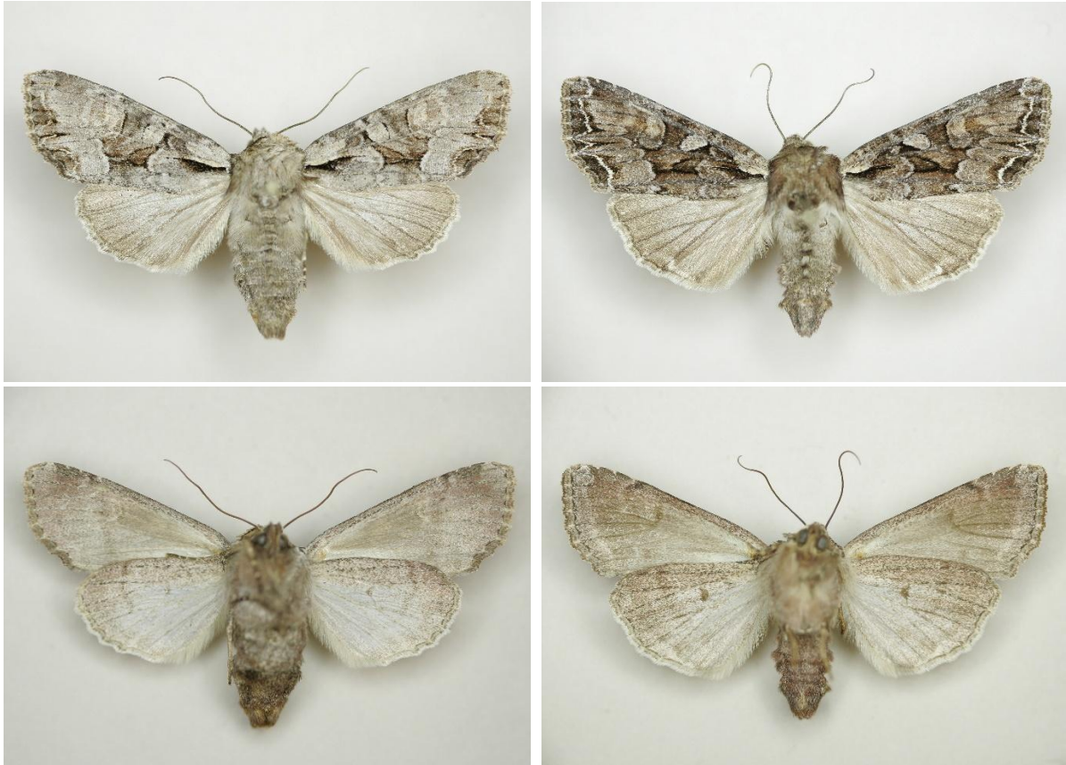
Figuur 3. Boven- en onderzijde van vrouwtje L. w-latinum (links; Wijnjewoude, 20.v.2014) en L. thalassina (rechts; Ureterp, 18.v.2003). Leg., col. en foto's G. Tuinstra.

De onderzijden van de vleugels van L. thalassina zijn vaak wat krachtiger gekleurd en getekend, waardoor vooral op de achtervleugel de dwarslijn-/band en donkere middenstip duidelijker zijn.